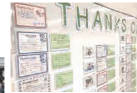
互いの良いところ探しができるサンクスカード。以前は壁一面に貼っていたが新社屋ではフロアが増え、現在はクラウド上でのやりとりに変更した