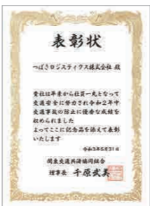
関東交通共済協同組合から贈られた賞状