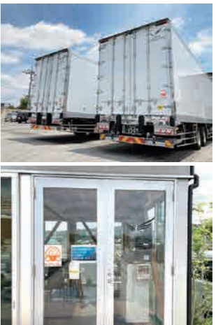
働きやすい職場認定制度の認定マーク

多摩地域の大手スーパーを中心にした食品輸送と、精密機器輸送を行っているつばさロジステイクスは、一九七四年創業の老舗事業者、高栄運輸の子会社であったKOEーロジステイクス（精密機器輸送）が、高栄運輸の食品輸送事業を事業分割で吸収し設立しました。二〇二一年には共に所属する「つばさトラック事業協同組合」の組合員である富士輸送の食品部門を事業継承し、つばさトラッククリエイションを合併。